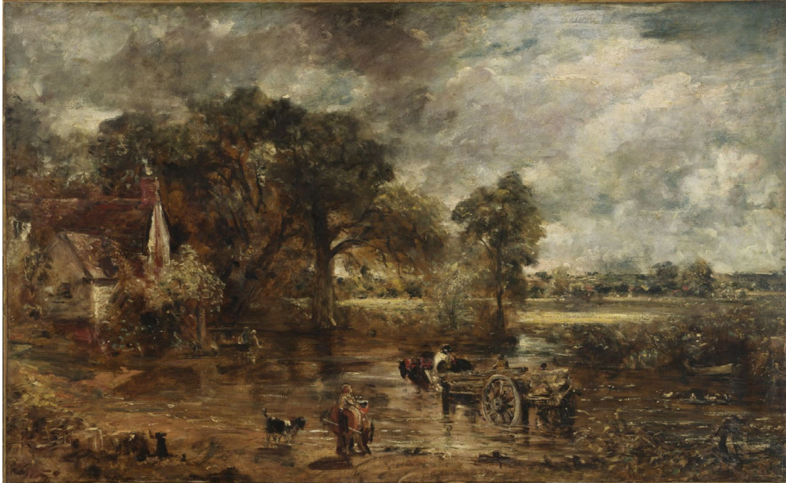
John Constable Etüüd maalile "Heinavanker", õli lõuendil, dateerimata