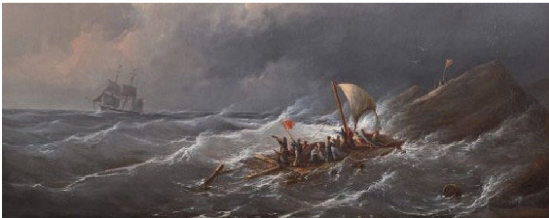
Näituselt: Romantiku pilguga.Hollandi ja Belgia 19.sajandi maalikunst Rademakersi erakogust.